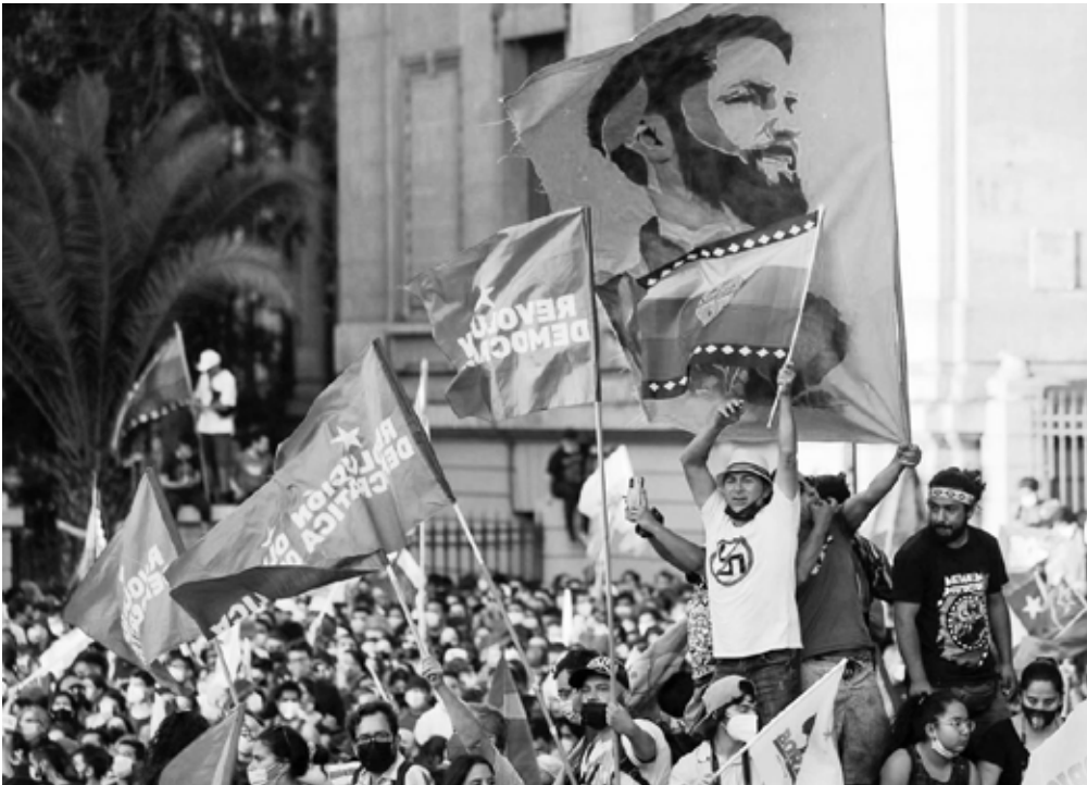
Boric-Anhänger:innen feiern

Trump während seiner Präsidentschaft die liberale Ordnung fundamental in Frage stellte.