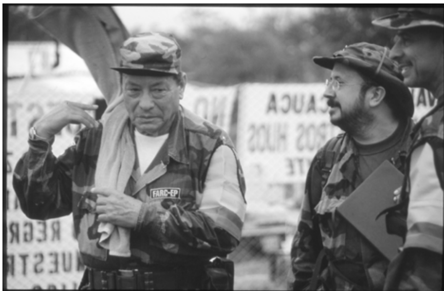
Manuel Marulanda alias Tirofijo, mit zwei weiteren FARC-Comandantes, 2001

Wenig verwunderlich ist es vor diesem Hintergrund, dass auch die gesellschaftliche Partizipation nicht zugenommen hat, wie im Friedensabkommen angestrebt. Ein Fanal war die äußerst brutale Niederschlagung sozialer Proteste ( Paro Nacional ) seit dem 28. April 2021 – begleitet von einem regierungsamtlichen Diskurs, der Demonstrant:innen je nach Kontext als „Terroristen“ oder als „Drogenhändler“ bezeichnete.