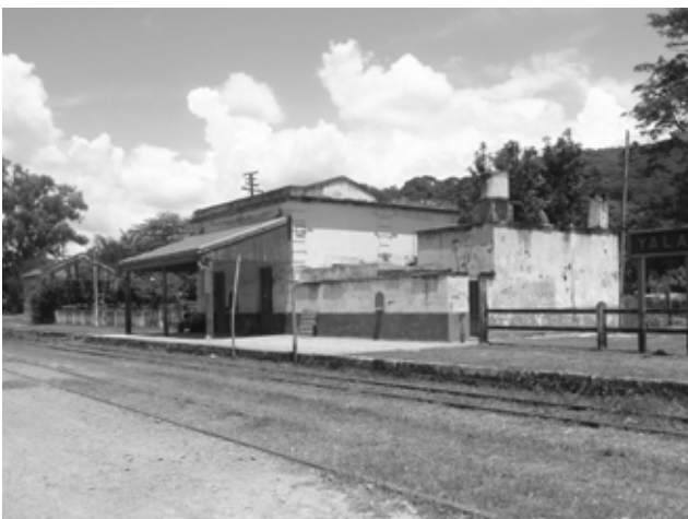
Die Bahnstation Yala in der Provinz Jujuy: Solares Revival?; © Laurin Blecha

Wird die Bahn für Bewohner:innen der Dörfer der Quebrada gratis sein, damit sie nicht weiter die teils teuren (und auch umweltschädlichen) Busse und Taxis nehmen müssen, auf die sie seit den 1990er Jahren angewiesen sind? Wird die Bahn im Sinne der Ruta Inca die Bevölkerungen Argentinien und seiner nördlichen Nachbarländer näher zusammenbringen und die historische kulturelle Vielfalt wiederbeleben? Ein breit geführter gesellschaftlicher Dialog mit indigenen Gemeinschaften und Anwohner:innen wäre hier der gangbarste Weg, das ambitionierte Projekt gesellschafts- und umweltpolitisch in die richtige Bahn zu leiten. ●