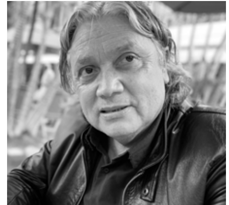
Navarro Brains

Navarro Brains: Ich kann das am besten an meinem Beispiel erklären: Nachdem ich 1976 den Todeszellen der Militärdikta-