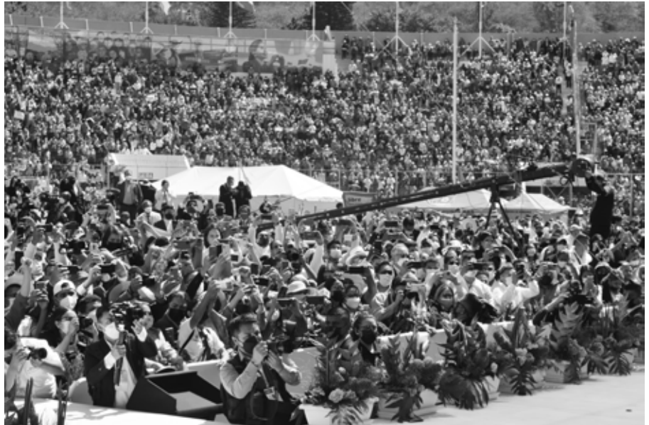
Tausende verfolgten die Angelobung im Stadion von Tegucigalpa; © Leo Gabriel

16 Jahre lang hatte Carías Andino, ein Verbündeter der US-Bananengesellschaft