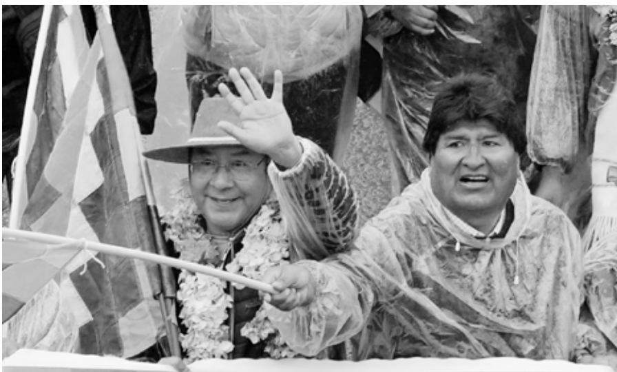
Luis Arce (links) und Evo Morales