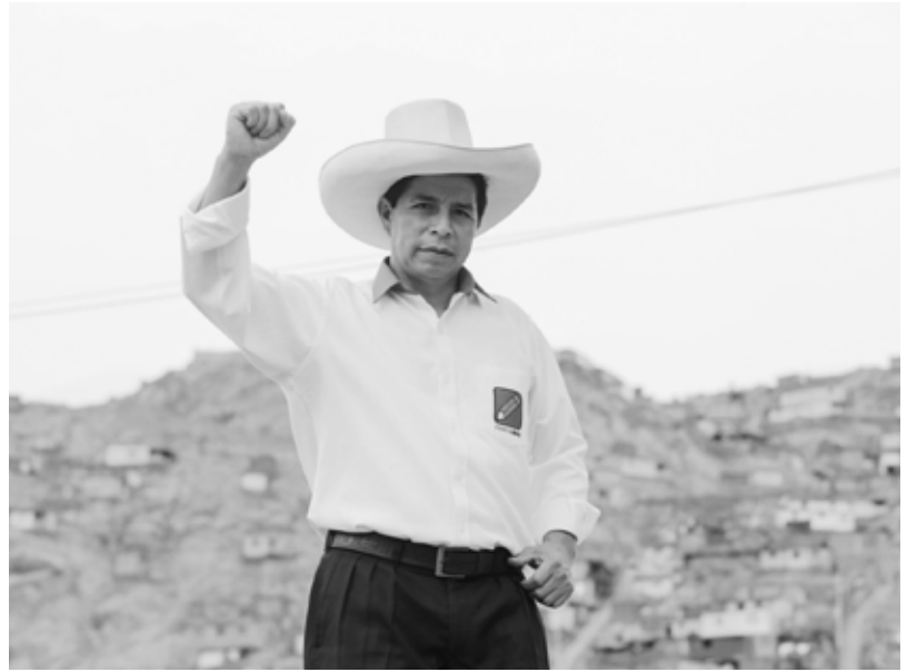
Pedro Castillo: Stehen seine Wähler:innen noch hinter ihm?

Doch bald zeigten sich Friktionen mit dem Chef. Der überforderte Präsident hatte sich inzwischen mit einer Phalanx an Beratern – darunter keine Frau – umgeben. Dieser Kreis entwickelte schnell ein Eigenleben. Fragwürdige Personalentscheidungen häuften sich und Minister:innen hatten Schwierigkeiten, sich mit dem Präsidenten abzustimmen. Die Planlosigkeit Castillos kam zum Vorschein, als er die Bemühungen seiner Ministerpräsidentin, die Bergbaukonzerne stärker in die soziale und umweltbezogene Verantwortung zu nehmen – ein Kernanliegen Castillos im