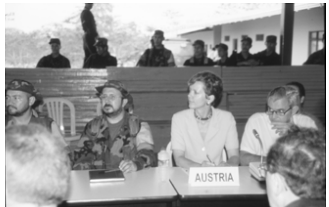
Friedensverhandlungen 2001, damals saß noch die österreichische Botschafterin mit am Tisch; © Robert Lessmann

Auch wenn die vorgesehenen Fristen nach allen Erfahrungen viel zu ehrgeizig waren, wurden unter der Regierung Santos immerhin 106 solcher kollektiven Ab-