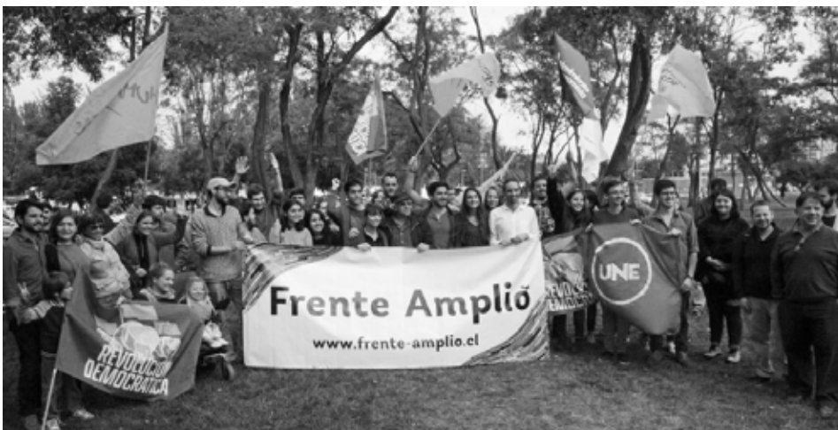
Aktivist:innen des Frente Amplio