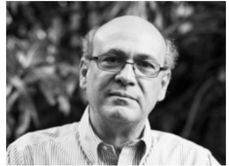
Carlos Fernando Chamorro

Das waren Hunderte von Fake-Accounts, mit denen das Regime in den sozialen Medien Stimmung gegen Regimekritiker:innen gemacht hat. Das lief vor allem über das Telekommunikationsinstitut Tel-