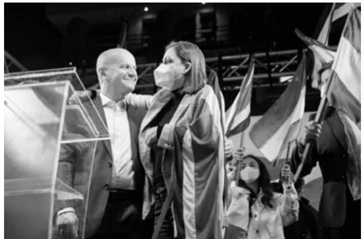
Figueres und Ehefrau

Costa Rica rühmt sich, eine der ältesten und stabilsten Demokratien Lateinamerikas zu sein. Dieser Mythos wird alle vier Jahre kräftig gepflegt, wenn die Wahlen als Fest der Demokratie aller Costa-Ricaner:innen gefeiert werden. In der Tat ist Costa Rica im Vergleich zu den Nachbarländern von Umstürzen und Diktaturen weitgehend verschont geblieben. Weniger beachtet wird jedoch ein anderer Aspekt: Durch den Kaffee-Export entstand in der zweiten Hälfte des 19. Jahrhunderts erstmals eine Oberschicht – die Kaffee-Barone – gebildet aus erfolgreichen Nachfahren der spanischen Eroberer und neuen Einwanderern aus verschiedenen europäischen Ländern.