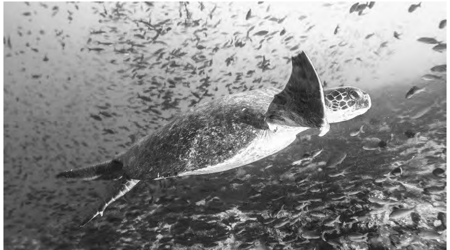
Nicht zuletzt Meeresschildkröten sollen von der Ausweitung des Schutzgebiets im östlichen Pazifik profitieren; © Luis Felipe V. Puntel

Nicht nur dass eine solche Praxis gefährlich ist – es kam wiederholt nächtens zu Kollisionen zwischen Flottenbooten – ist natürlich anzunehmen, dass sie der Vertuschung des Eindringens in die Wirtschaftszone dient. Tatsächlich gilt illegaler Fischfang nach Drogen- und Waffenhandel als drittgrößter Schwarzhandelsbe-