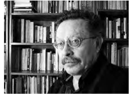
Bolívar Echeverría; © flickr.com

Was sich nach einem Verwerfen des Subjektbegriffes anhört, ist vielmehr Ausdruck einer Kritik an der Vorstellung des menschlichen Subjekts als eines in seinen Entscheidungen völlig freien, also eine Kritik gewisser idealistischer Subjektkonzeptionen. Jedoch geht Echeverría bei seiner Bestimmung der Grenzen der Freiheit des Subjekts über diejenige von Marx hinaus, der diese Begrenzung im Schein der Eigen-