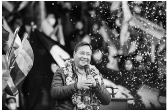
Luis Arce am Abend seines Wahlsiegs; © Xinhua

Ein Jahr nach der Amtseinführung von Präsident Arce und Vizepräsident Choquehuanca kann man eine überwiegend positive Bilanz ziehen. Unter dem Pragmatiker Arce wurden große Anstrengungen für eine