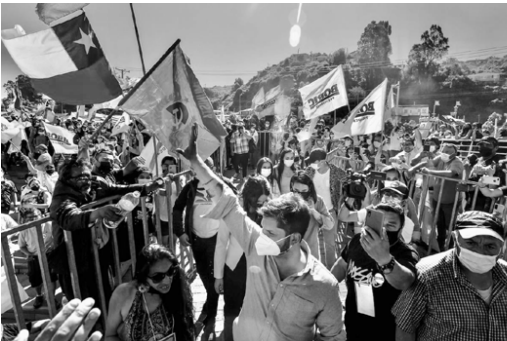
Gabriel Boric im Wahlkampf

In den internationalen Medien wurden nach der Präsentation des Kabinetts zwei Punkte hervorgehoben: Ihm gehören im Verhältnis von 14 zu 10 erst-