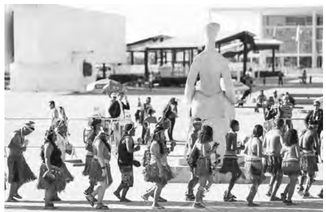
Indigene Demonstration vor dem Obersten Gerichtshof in Brasilia, Juni 2021

Gemäß mehrerer staatlicher Verordnungen ist in Brasilien bei Umweltverträglichkeitsverfahren eine sogenannten „indigene Komponente“ (CI-PBA) vorgesehen, die darauf abzielen müsste, negative Auswirkungen eines Projektes abzumildern,