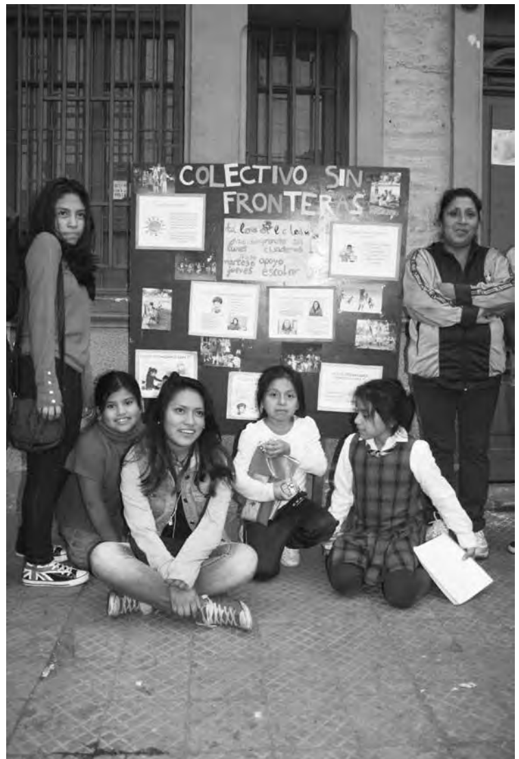
Kinder werben für „ihr“ Projekt und die Hausaufgaben-Unterstützungsangebote des „Colectivo sin Fronteras“