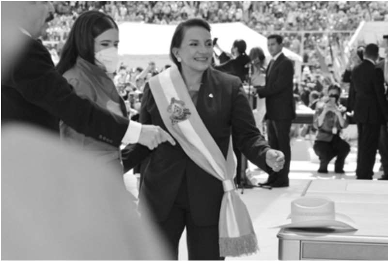
Xiomara Castro nach ihrer Amtseinführung am 27. Jänner