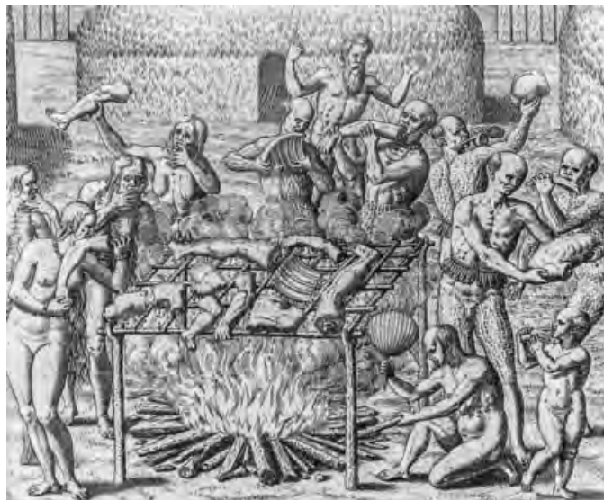
Kannibalismus in Brasilien, 1557

Die „Zähmung“ bzw. Überwindung dieses undurchdringlich scheinend grünen Dickichts ist dann auch filmisch in Herzogs Film Fitzcarraldo (1982) Schauplatz eines „Kampfes der Moderne“ gegen die