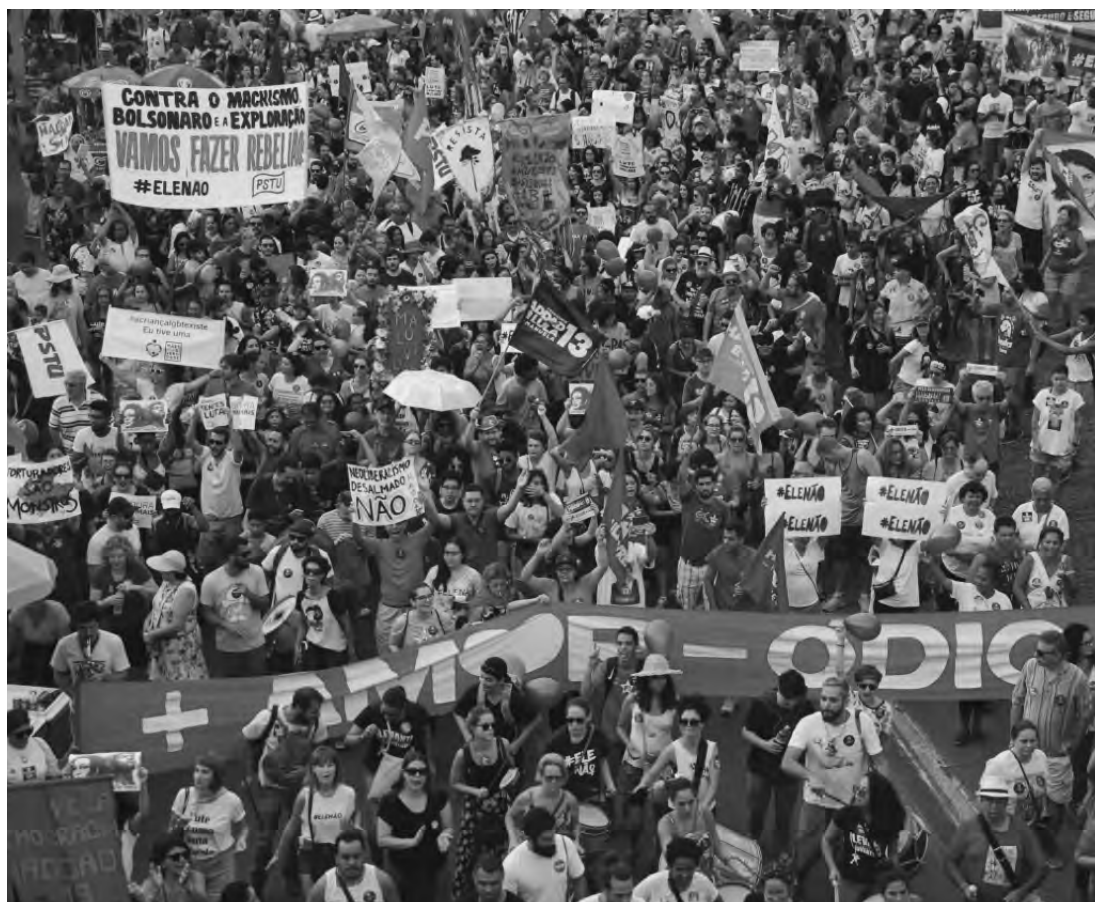
Noch vor Bolsonaros Amtsantritt kam es zu massiven Protestdemonstrationen

Herrschaft, darum, anderen seinen Willen aufzuzwingen.