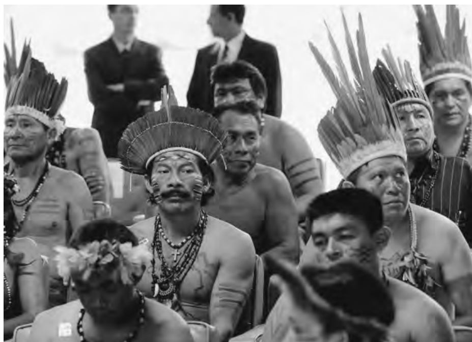
Indígenas des von der Schließung bedrohten Reservats Raposa do Sol