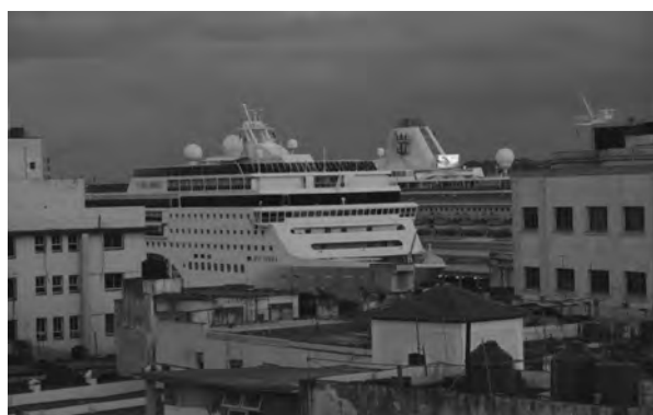
Kreuzfahrttourismus nach Havanna blüht trotz Trump

Durchschnitt nicht schlechter als im Rest Lateinamerikas. Doch sei man – nicht zuletzt durch die Politik der USA – von Krediten weitgehend abgeschnitten und müsse, um überhaupt eine Chance auf frisches Geld zu wahren, viel Energie auf die Bedienung des Schuldendienstes für bestehende Schulden verwenden – zu Lasten notwendiger Investitionen. „Wir bräuchten jährlich zwei Milliarden an Krediten oder Auslandsinvestitionen“, schätzt JLR und beschreibt Teufelskreise: „Wenn wir investieren wollen, können wir das nicht auf Kosten des Konsums tun, denn die Menschen leiden ohnehin stark unter der Krise“.