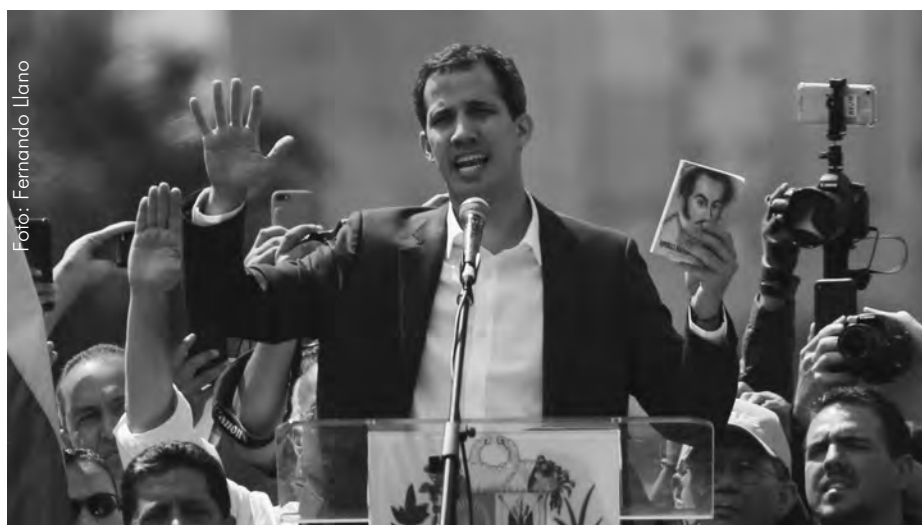
Am 23. Jänner erklärte sich Juan Guaidó zum Übergangspräsidenten

Im Unterschied zu Lulas Brasilien und dem Argentinien der Kirchner-Ära musste Hugo Chávez bereits vom ersten Tag seiner Amtsübernahme im Februar 1999 an gegen einen zwar ziemlich inhomogenen, aber dafür umso aggressiveren „historischen Block“ der bürgerlichen Eliten ankämpfen, der bei den Wahlen regelmäßig mit etwa 40 Prozent der abgegebenen Stimmen rechnen konnte. Und als Chávez zwei Jahre nach der Verabschiedung der Verfassung der Bolivari-schen Revolution den Zugriff auf die staatliche Erdölgesellschaft PDVSA wagte, wäre er im April 2002 bei einem militärischen Putschversuch beinahe unter die von den USA aus manipulierten Räder gekommen.