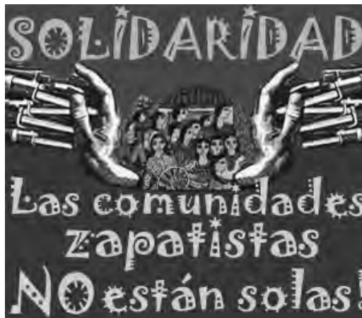
Solidarität mit den zapatistischen Gemeinden!

López Obrador sucht Investoren für einen transisthmischen Korridor von Tehuantepec und den Bau eines Maya-Zuges zur touristischen Erschließung des Landes mit einem 1.525 Kilometer langen Schienennetz. Siemens hat am Maya-Zug-Projekt als weltweit zweitgrößter Produzent von Zügen bereits großes Interesse bekundet. Die Infrastrukturprojekte würden sensible Ökogegebiete zerstören und indigene Lebensräume im Zapatisten-Gebiet bedrohen. López Obrador argumentiert mit dem Versprechen von Wohlstand und Entwicklung für das mexikanische Volk und ließ das Volk befragen. Für das Maya-Zug-Projekt stimmten z.B. 90 Prozent der Befragten. 4