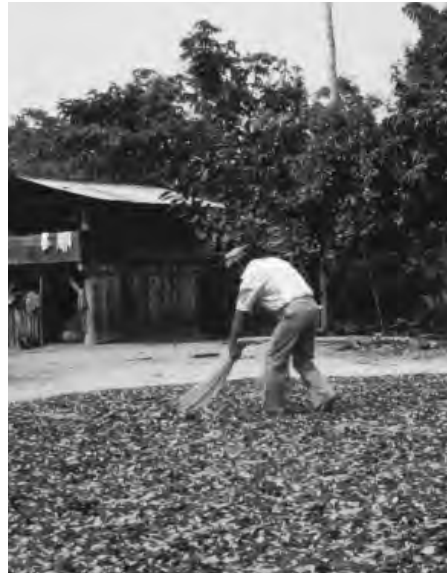
Kokablätter, zum Trocknen aufgelegt

Die Blätter des Koka-Strauchs enthalten Kokain als eines von bis zu 16 Alkaloiden. Es gibt auch Sorten, die kein Kokain enthalten. Um Kokain zu gewinnen, weicht man die Blätter zunächst in Lösungsmittel (vorzugsweise Kerosin) ein und gewinnt unter Hinzugabe einer Reihe weiterer Chemikalien (darunter Schwefel-