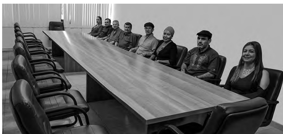
Die Regierungsdelegation kehrt nicht an den Verhandlungstisch zurück.

Auch die Vertreibung der Landbevölkerung fand kein Ende: 2018 wurden mehr als 30.000 Menschen aufgrund von Drohungen oder bewaffneten Konflikten zu Binnenflüchtlingen. Betroffen waren vor allem Menschen aus den ländlichen und strukturschwachen Regionen Cauca, Antioquia und Norte de Santander.