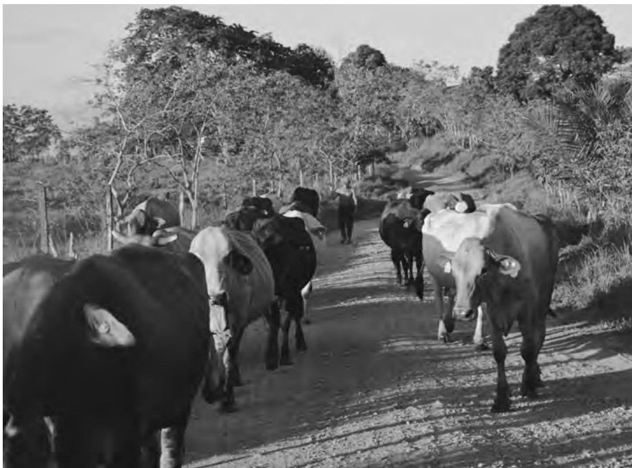
Weideflächen wachsen auf Kosten des Regenwalds, auch im Caquetá

Sie befürchtet einen Genozid indigener Völker nach den Ankündigungen des neuen Präsidenten, doch sie würden Widerstand leisten. Sollte die EU jedoch mit ihrer Handelspolitik diesen Fragen jetzt aus dem Weg gehen, dann würde sie „wissentlich den Genozid von Menschen und Kulturen und die beschleunigte Vernichtung der Umwelt und den Klimawandel ignorieren“, sagte Sônia Guajajara dem britischen Guardian . „Das wird nicht nur Konsequenzen für indigene Völker, sondern auch für den Planeten als Ganzes haben.“ ■