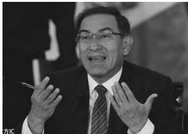
Präsident Martín Vizcarra bremste den Waldschutz ein

Seither gab es eine Reihe von Versuchen, die Tätigkeit von OSINFOR zu behindern, sei es durch Budgetkürzungen, Beschneidung von Zuständigkeiten oder die Diskussion über eine Eingliederung in die Forstbehörde oder ein Ministerium. Aus den Plänen wurde lange nichts, da sie dem Freihandelsabkommen widersprachen. Am effektivsten erwies sich noch das finanzielle Gängelband auf Umwegen: Die Agentur sollte ursprünglich ein Viertel