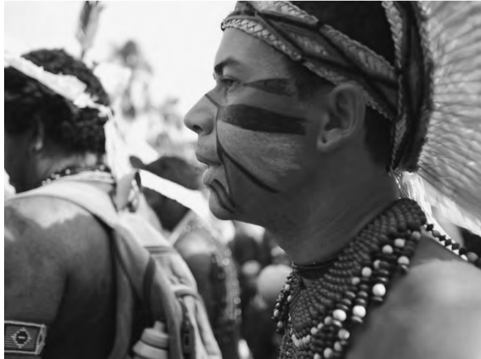
Invasionen und Angriffe bedrohen seinen Lebensraum

Im Mittelpunkt ihres Weltbildes steht eine Organisation des Wissens, die extrem integrativ ist und somit Dichotomien verabscheut; Vielfalt und Widerspruch sind Ordnungsprinzipien, und die Regeln der logischen Ausschließlichkeiten, so wie wir Europäer es von den alten Griechen gelernt haben, sind für Amazonier wirklichkeitsfern und somit irrelevant. Etwas Lebendiges kann das eine, aber auch etwas anderes sein, denn die mehrfache Verwandlungsfähigkeit aller Akteure der Schöpfung ist eine Grunderkenntnis; alle Lebewesen