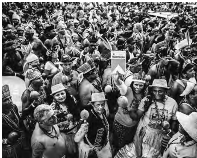
Brasilien Indigene demonstrieren ihre Bereitschaft zum Widerstand gegen Bolsonaros Angriffe

„Der Schrecken ist bereits Gegenwart“, schrieb die bekannte Journalistin Eliane Brum. Ermuntert von den Sprüchen Bolsonaros bedrängten illegale Holzfäller und Landräuber schon in der Vorwahlzeit Indigene, kriminalisierten Nichtregierungsorganisationen und drängten deren Einfluss massiv zurück. Nach der Wahl war schnell klar, dass für die Regierung des gewählten Präsidenten das Amazonasgebiet nur eine Schatzkammer darstellt, die sie plündern möchte. Man plant weitere Projekte wie Staudämme, große Rinderfarmen oder Sojaplantagen. Durch organisatorische Umstrukturierungen wurden die Lebensbedingungen der Indios bereits eingeschränkt: Wesentliche Kompetenzen der Bundesbehörde für indigene Angelegenheiten wurden dem Agrarministerium übertragen, das traditionell die wirtschaftliche Ausbeutung des Amazonasgebiets vorantreibt. Die bereits 1988 in der Ver-