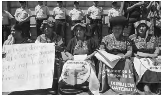
Protest von Witwen der CONAVIGUA vor dem Kongress

Auch wenn sein Bruder und sein Sohn wegen Geldwäsche und Betrug angeklagt sind, handelt es sich bei der Kampagne gegen die CICIG um mehr als eine persönliche Racheaktion des Präsidenten. Dahinter stehen jene mit der alten militäri-