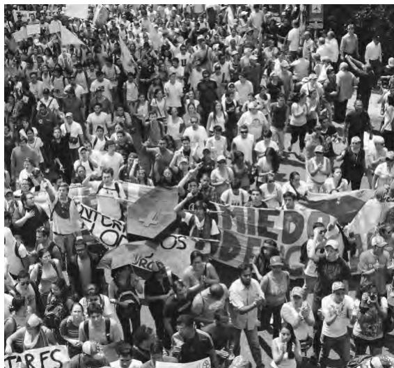
Guaidó rief zu neuen Massenprotesten auf

Aber auch das Gerede von der Demokratie, dem Schutz der Menschenrechte und der „humanitären Hilfe“, das derzeit die Zeilen einer völlig desorientierten Weltspresse (mit wenigen Ausnahmen) füllt, ist ein Scheingefecht, in dessen Schatten bereits militärische Kräfte Auf-