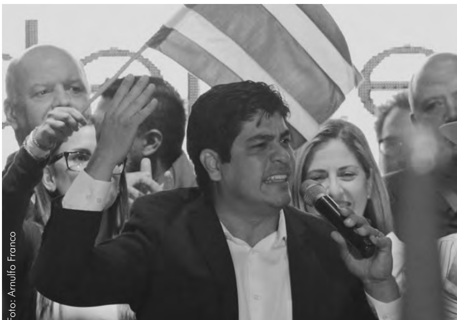
Der Wahlsieger und neue Präsident Carlos Alvarado

Gruppen von Gays und Lesben organisierten bunte, schrille Demonstrationen, und im Parlament steht eine Entscheidung über die Anerkennung gleichgeschlechtlicher Ehen an. Die Gegner solcher Tendenzen sehen darin nicht Weltoffenheit und Toleranz, sondern Sitten- und Werte-