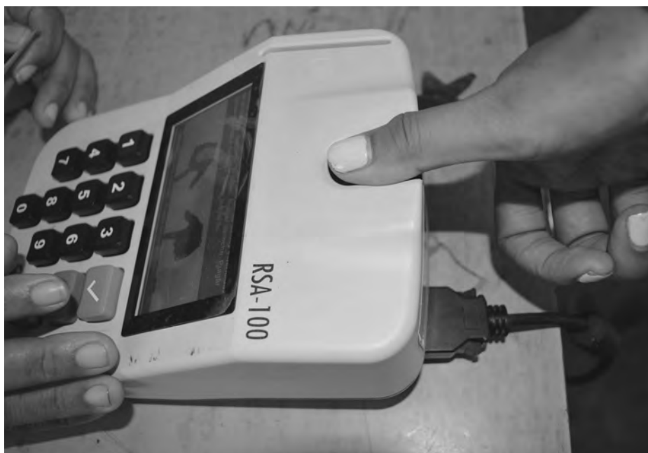
Identitätskontrolle bei den venezolanischen Gouverneurswahlen im Oktober 2017

Das gleiche Schicksal könnte auch den venezolanischen Staatspräsidenten Nicolás Maduro treffen, der im Unterschied zu seinem berühmten Vorgänger Hugo Chávez