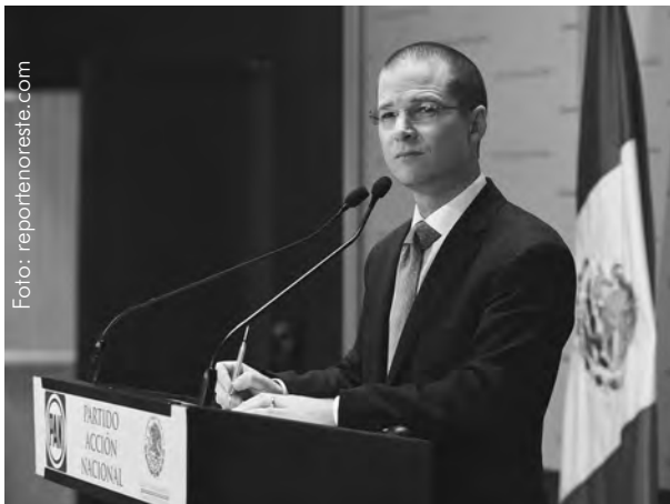
Ricardo Anaya, AMLOs aussichtsreichster Konkurrent

In erster Linie, weil Mexiko vor der größten Wahl seiner Geschichte steht: der Präsident, 128 Senatoren, 500 Abgeordnete, 9 Gouverneure, darunter Mexiko Stadt, 928 Sitze in 27 Kongressen der Bundesstaaten und tausende lokale Ämter. Für die 90 Millionen wahlberechtigten MexikanerInnen werden 150.000 Wahllokale zur Verfügung stehen.