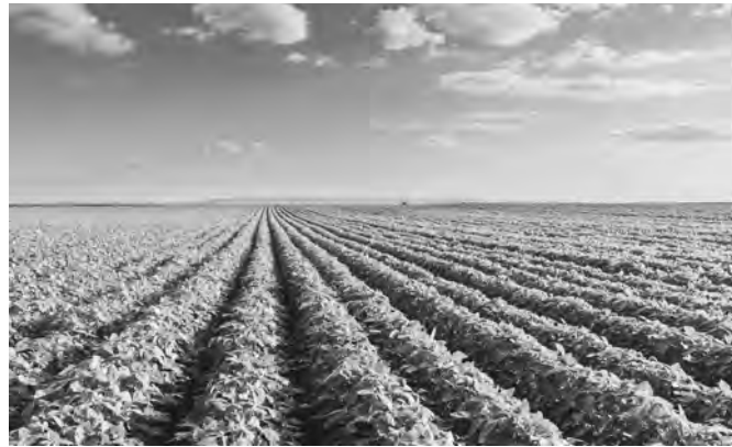
Extensiver Sojaanbau – und Pestizideinsatz