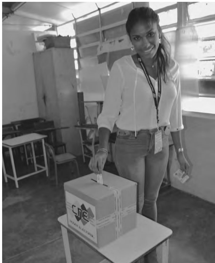
Venezuela, Gouverneurswahlen am 15. Oktober 2017

die seit zwei Jahren überhand nehmende Wirtschaftskrise nicht in den Griff bekommt; bloß dass sich die rechtsradikale Opposition insoweit verschätzt haben dürfte, als sie sich mit ihrem Wirtschaftsboykott und einer ausufernden Gewaltwelle gegen Maduro ins eigene Fleisch geschnitten hat und gerade jetzt, wo es darum ginge, im Hinblick auf die am 20. Mai stattfindenden Wahlen vor der notleidenden Bevölkerung ein Bild der Einheit zu zeigen, heillos zerstritten ist.