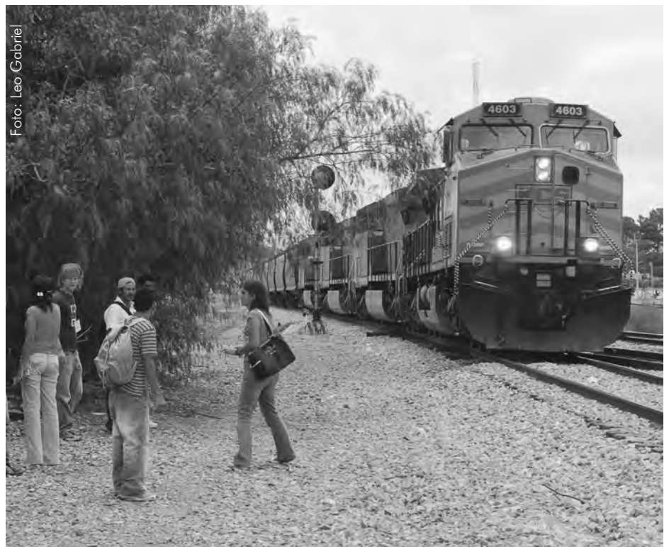
„La Bestia“, Mexiko: gefährliche Reise in Richtung Norden

Migration wird im Bericht von Guterres als Chance gesehen und als Herausforderung. Geordnete und sichere Migration zu ermöglichen, sei das Ziel. 258 Millionen Menschen, rund 3 Prozent der Weltbevölkerung, sind derzeit Migranten; 48 Prozent davon Migrantinnen. Etwa 85 Prozent ihrer Einkünfte bleiben im Gastland, sei es als Steuern oder als Ausgaben. Die verbleibenden 15 Prozent fließen in die Herkunftsländer. 2017 wurden so rund 596 Milliarden US-Dollar dorthin überwiesen, 450 Milliarden davon in sogenannte Entwicklungsländer – das war dreimal soviel wie die offizielle Entwicklungszusammenarbeit aller Geberländer.