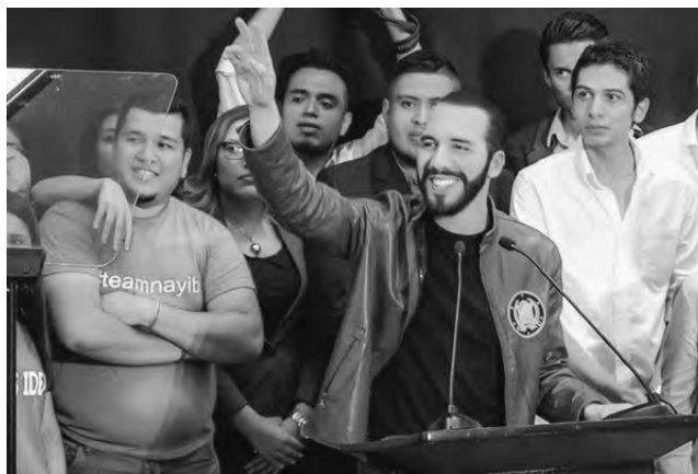
Bukele bei der Präsentation seiner neuen Partei (2. April)

Der Parteiausschluss nur wenige Monate vor den Wahlen verunmöglichte