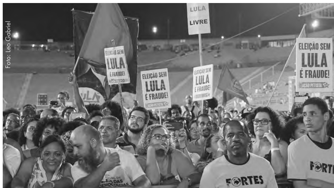
„Eine Wahl ohne Lula ist Betrug“: Protest beim Weltsozialforum gegen Lulas Verhaftung

Während viele PT-ler hinter Gittern sitzen, endete noch kein Korruptionsprozess gegen die zahlreichen verdächtigten PDSB-Politiker mit einer rechtsgültigen Haftstrafe. Dass Mitglieder der jetzigen konservativen Regierung teilweise juristisch verfolgt werden, ist in erster Linie darauf zurückzuführen, dass sie zuvor Teil der PT-Regierungskoalition waren und just deswegen in das Visier von Moro und seinen Ermittlern gerieten.