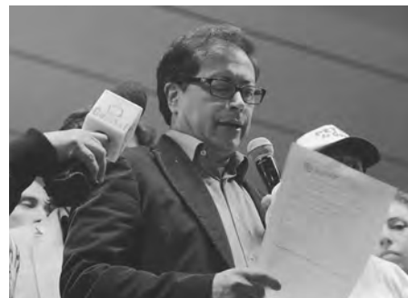
Linkskandidat Gustavo Petro

Uribes Kandidat Iván Duque hat sich in den Umfragen mit 40 Prozent der Wählerpräferenzen an die Spitze gesetzt. Der ehemalige Vizepräsident Varga Lleras,