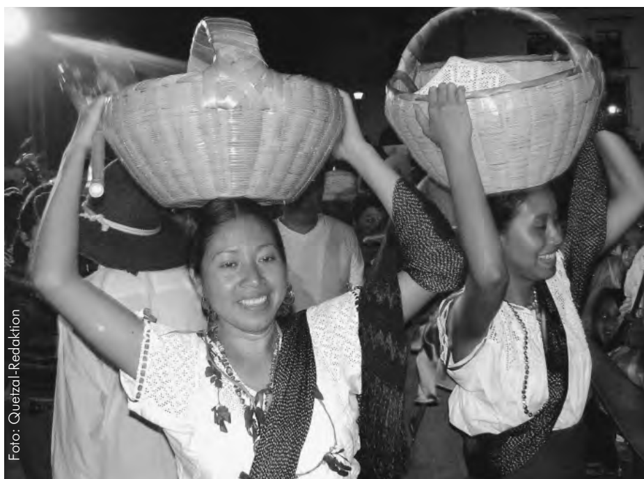
Die „tragende Rolle“ indigener Frauen in Mexiko beschränkt sich auf den Alltag