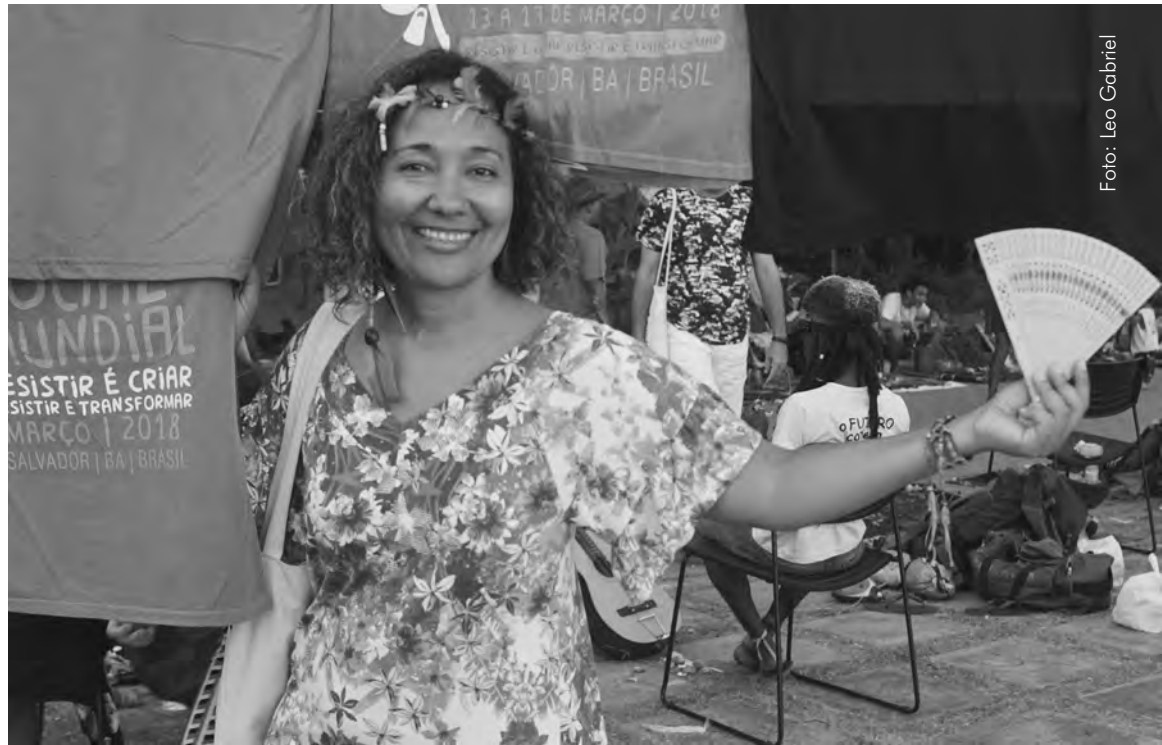
Eine gleichberechtigte Rolle wollen die Frauen nicht nur im Weltsocialforum spielen

ist enorm wichtig. Außerdem erreichen vor allem Frauen, die als Gemeinderätinnen und Bürgermeisterinnen kandidieren, durch soziale Medien WählerInnen, die sie aufgrund ihrer Einschränkung durch familiäre Pflichten nie erreichen würden: Während es für Männer völlig normal ist, von Wahlveranstaltung zu Wahlveranstaltung auch bis spät in die Nacht zu ziehen,